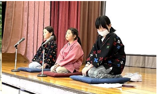
学年懇談会をしているとき、体育館では子ども語り部の発表会をしました。自分もやってみたい!と思う人はぜひ校長先生までお知らせください。