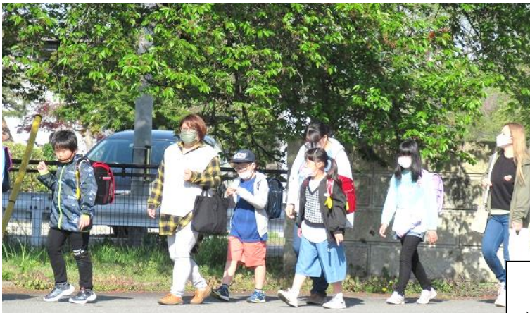
親子で登校へのご協力ありがとうございました。

100周年の特別な1年間を、子ども達と共に「たのしむ」1年間にしてみたいです。ご理解・ご協力をどうぞよろしくお願いいたします。